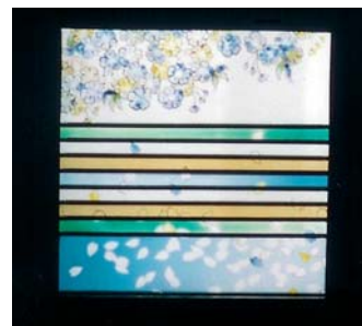
Sakura (boutons de cerisier) , détail d'un panneau-fenêtre. Sachiko Matsumoto, Chiba, Japon. H : 1,10m.