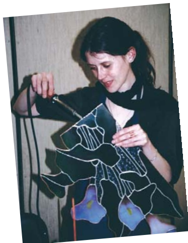
Il suffit parfois d'une démonstration technique pour décider d'une vocation. Celle, organisée par La Maison du Vitrail pendant la biennale, déploie des arguments de charme mais demeure ferme sur la précision du geste.