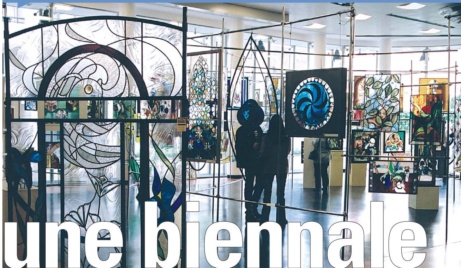
La 4ème biennale internationale du vitrail : un espace lumière dans la Salle des Colonnes, de Bourg-la-Reine.