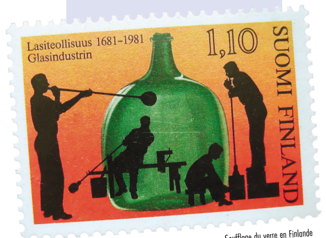
Soufflage du verre en Finlande